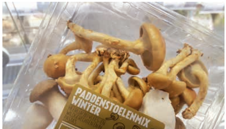
Deze kosten 3 euro. Wat zal de herkomst zijn?

worden zoals de NEN 2778 omschrijft. De constructie dient zo uitgevoerd te worden dat eventueel door de dakbedekking doorgedrongen water en/of stuifsnieuw door een waterkerende laag wordt opgevangen en naar de aansluitende uitwendige scheidingsconstructie wordt gebracht. (NPR 2652)