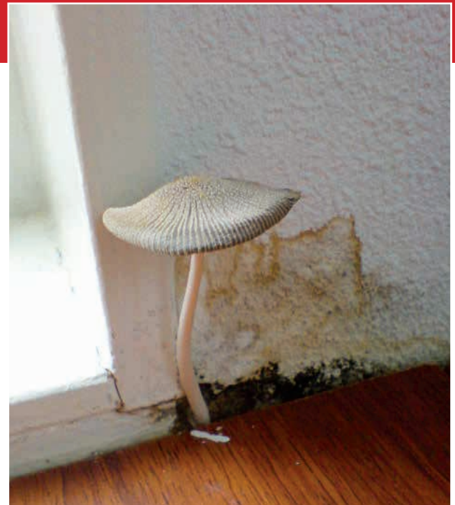
Dit is inmiddels de tweede lichter: Teun. Hij is drie weken oud en zijn wieg is een combinatie van metselwerkbaarden die contact maken met het binnenblad. Deze is gratis; herstellkosten zijn echter € 2.250,-

Zorg er dus voor dat er geen warme vochtige ondergrond kan ontstaan!