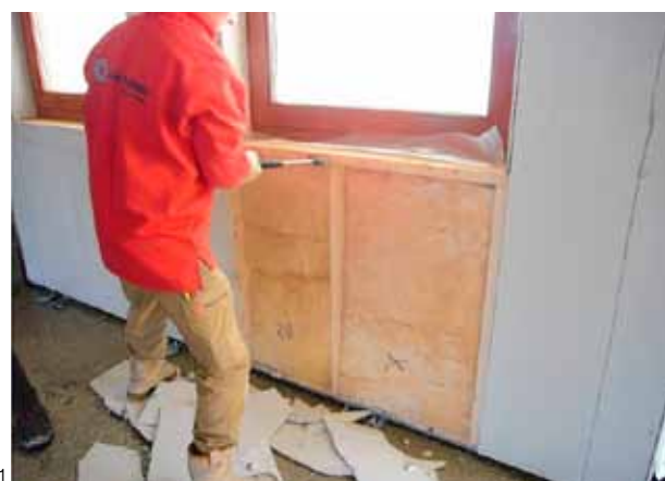
1-2 Herstelwerkzaamheden door slecht uitgevoerd prefab timmerwerk.

De Nederlandse Bond voor Timmerindustrie (NBvT) stelt bijvoorbeeld de specifieke incompanytraining met als thema 'isolatie en luchtdichting' beschikbaar aan haar leden door deze tijdelijk te subsidiëren. Stichting Scholings- en Werkgelegenheidsfonds Timmerindustrie (SSWT) noemt deze incompanytraining "een zeer leerzaam traject waarvoor men geen enkele vooropleiding nodig heeft".